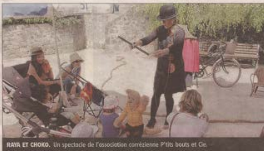
RAYA ET CHOKO. Un spectacle de l'association corrézienne P'tits bouts et Cie.

Cette création pour les petits s'inspire de la traditionnelle technique de contes japonaise, le kamishibai. « Il s'agit d'un petit théâtre d'images. À l'époque, les marchands ambulants japonais de